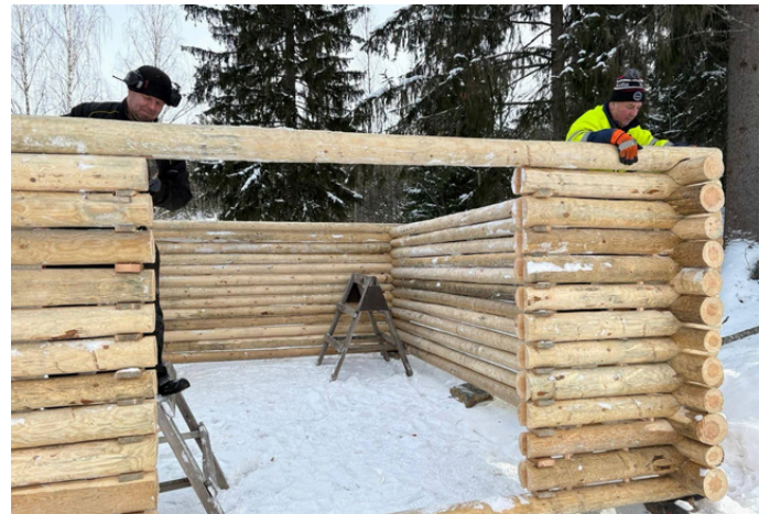
Tukkireille ja keltuveneelle tarvitaan erilliset katokset. Tekijänä Tukki-laistuvan naapurista Teppo Anttila (Puruntekijä).