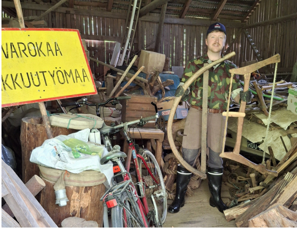
Täältä kaikki alkoi: Kotirannan riihestä.

Reilun vuoden kestänyt hanke alkaa olla loppusuoralla. On siis aika pohtia kulunutta vuotta ja Tukkilaistuvan näyttelyn tekemistä näin hanketyöntekijän näkökulmasta.