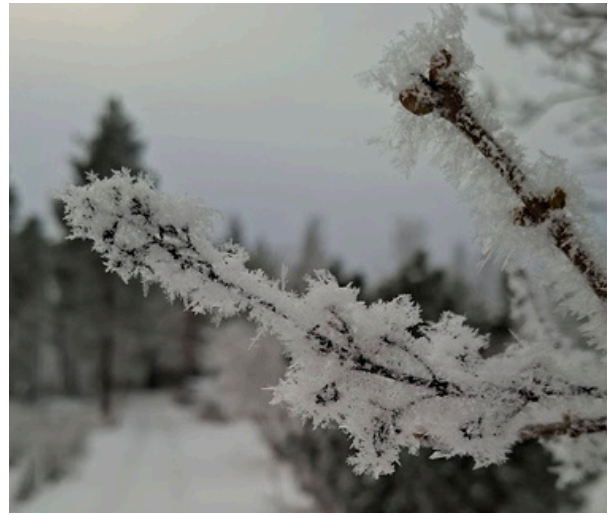
Kun kaikki hyyyty - mistä saa apua?

Olen käynyt ennen joulua tutustumassa lähivarautumiseen Kuhmoisten kunnassa. Esitystä oli seuraamassa kaikkien Kuhmoisten kylien edustajat. Meillä on hyvin erilaiset lähtökohdat, koska kaikilla ei ole kokoontumistiloja. Päijälässä niitä on kaksikin: Pirtti ja rukoushuone aggregaateineen. Kylän keskustassa sähkökatko ei yleensä kestä muutamaa tuntia kauempaa, joten kylätalolle voi tulla lämmittelemään, hakemaan vettä, tekemään ruokaa ja lataamaan laitteita. Tämä ei kuitenkaan auta