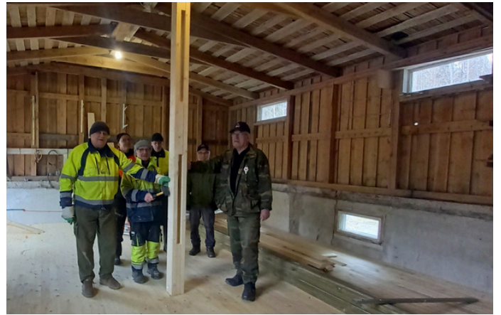
Varsinaisen näyttelyn rakentamisen rinnalla talkoolaiset ovat remontoineet varastotiloja niille esineille, jotka eivät mahdu näyttelyyn: 60 neliötä uutta lattiaa valmiina.