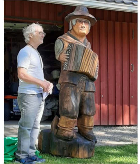
Patsas: Vesa Koskisen taidonnäyte

Teksti ja veljesten kuva: Merja Åkerlind Vanhat uittokuvat: Olli Lehdon kokoelma Kuva Ollista ja näköispatsaasta: Leena Bragge