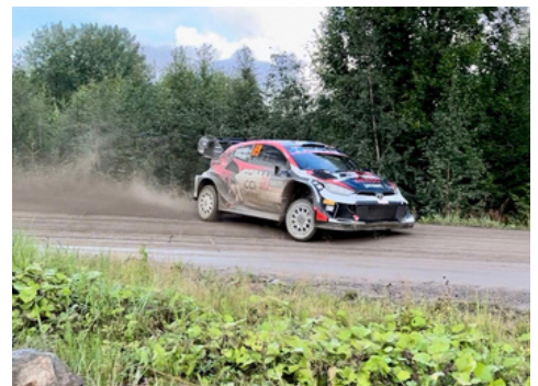
Ralli-infoa s. 15