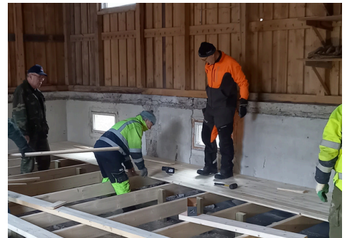
Tukki-laistuvalla vauhti kiihtyy ennen avajaisia. s. 5-6