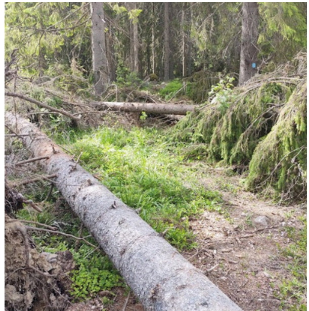
Jari-myrskyn tuhoa.

siihen, jos oma mökki kylmenee, vesiputket jäätyvät ja sulaessaan rikkovat ne. Miten silloin toimitaan? Kuka raivaa puut autotieltä? Vielä pahempi, jos tulee sairauskohtaus ja on saatava apua kauempaa.