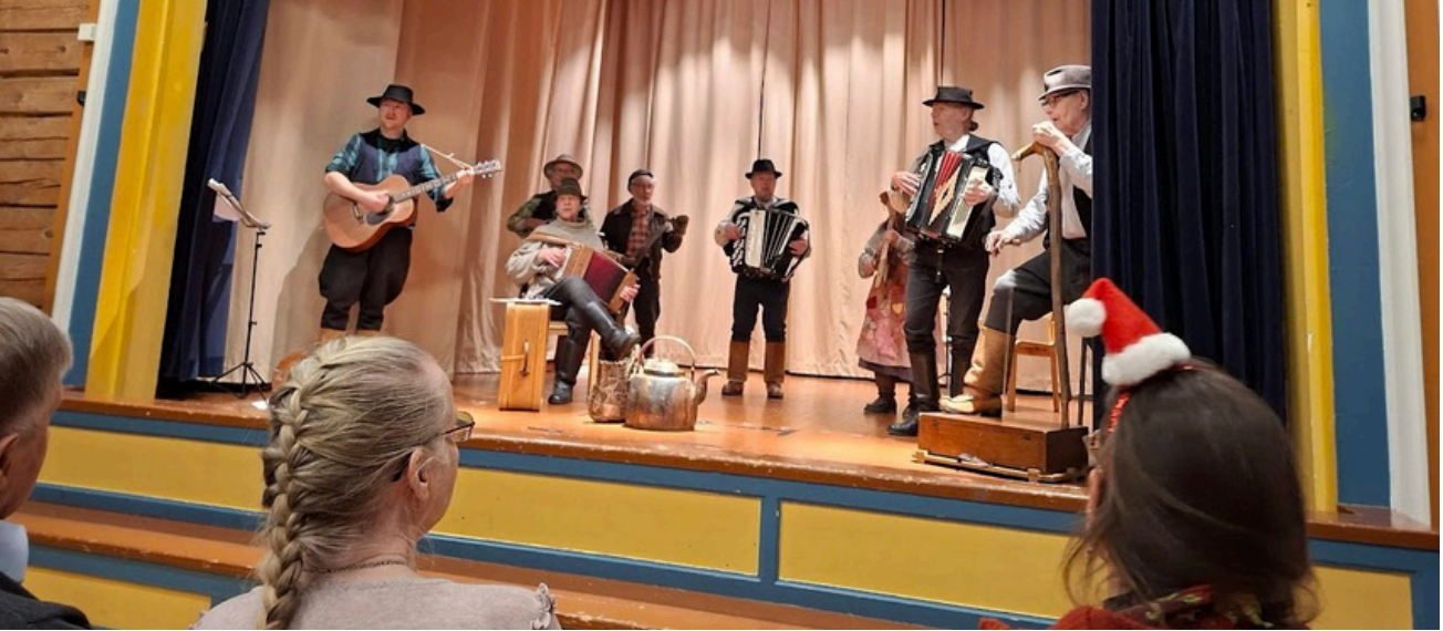
Jätkäperinneorkesteri vierailmassa Kuhmolassa Lähtörin muistikahvilan pikkujoulussa 8.12.2025