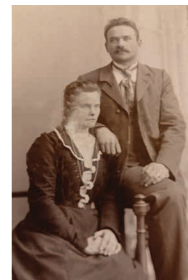
Tunteeko kukaan kuvan pariskuntaa? Eräältä mökiltä löytyi vanha valokuva-albumi täynnä toinen toistaan hienompia muotokuvia. Kannessa oli tämä kuva, jota epäillään albumin alkupeiräisten omistajien kuvaksi.

Hyötykasvikerhon perinteisen sadonkorjuulounaan menu: Maa-artisokka-kasviskeitto, hirvenkäristys, uunijuurekset, porkkanalaatikko, perunat, kaalikäärileet, piimäjuusto, minttuhyttelö, puolukkahillo ja salaatti sekä jälkiruokana kahvi ja kuningatarhillopiirakka. Hyvää oli!