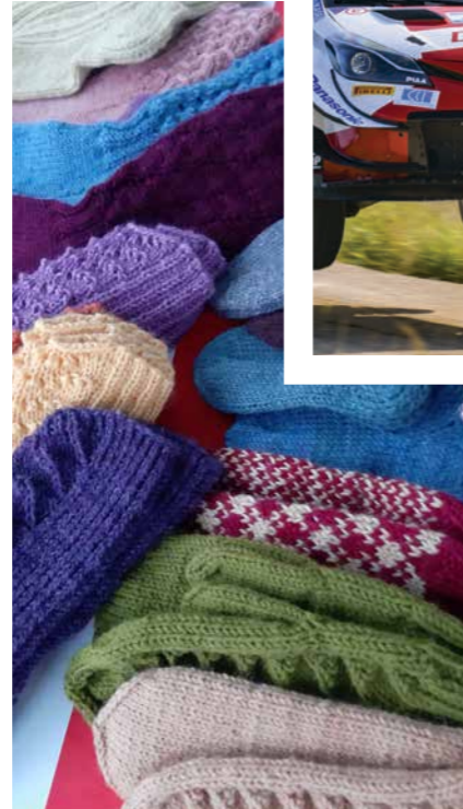
21 Päijälän tapahtumia