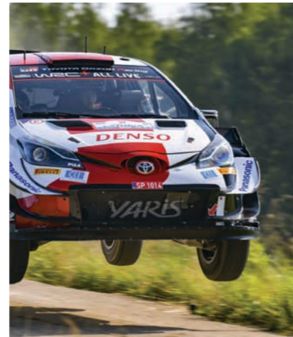
5 Secto Automotive Rally Finland