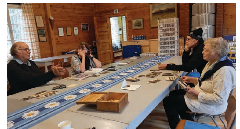
Kulttuuripäivässä 9.10. katseltiin Pirtillä vanhoja valokuvia kylältä. Niistä löytyy historiaa. Edesmenneet ihmiset, vanhat jo hävinneet rakennukset ja kylän erilaiset tapahtumat kuvissa kertovat eletystä elämästä. Suomalaisen kulttuurin päivää vietetään virallisesti 10.10., joka on Aleksis Kiven päivä ja myös liputuspäivä. Tässä kuvassa kuvanottohetkellä vain muutama osallistuja. Jotkut olivat jo lähteneet pois.

Hyötykasvikerhon perinteisen sadonkorjuulounaan menu: Maa-artisokka-kasviskeitto, hirvenkäristys, uunijuurekset, porkkanalaatikko, perunat, kaalikäärileet, piimäjuusto, minttuhyttelö, puolukkahillo ja salaatti sekä jälkiruokana kahvi ja kuningatarhillopiirakka. Hyvää oli!