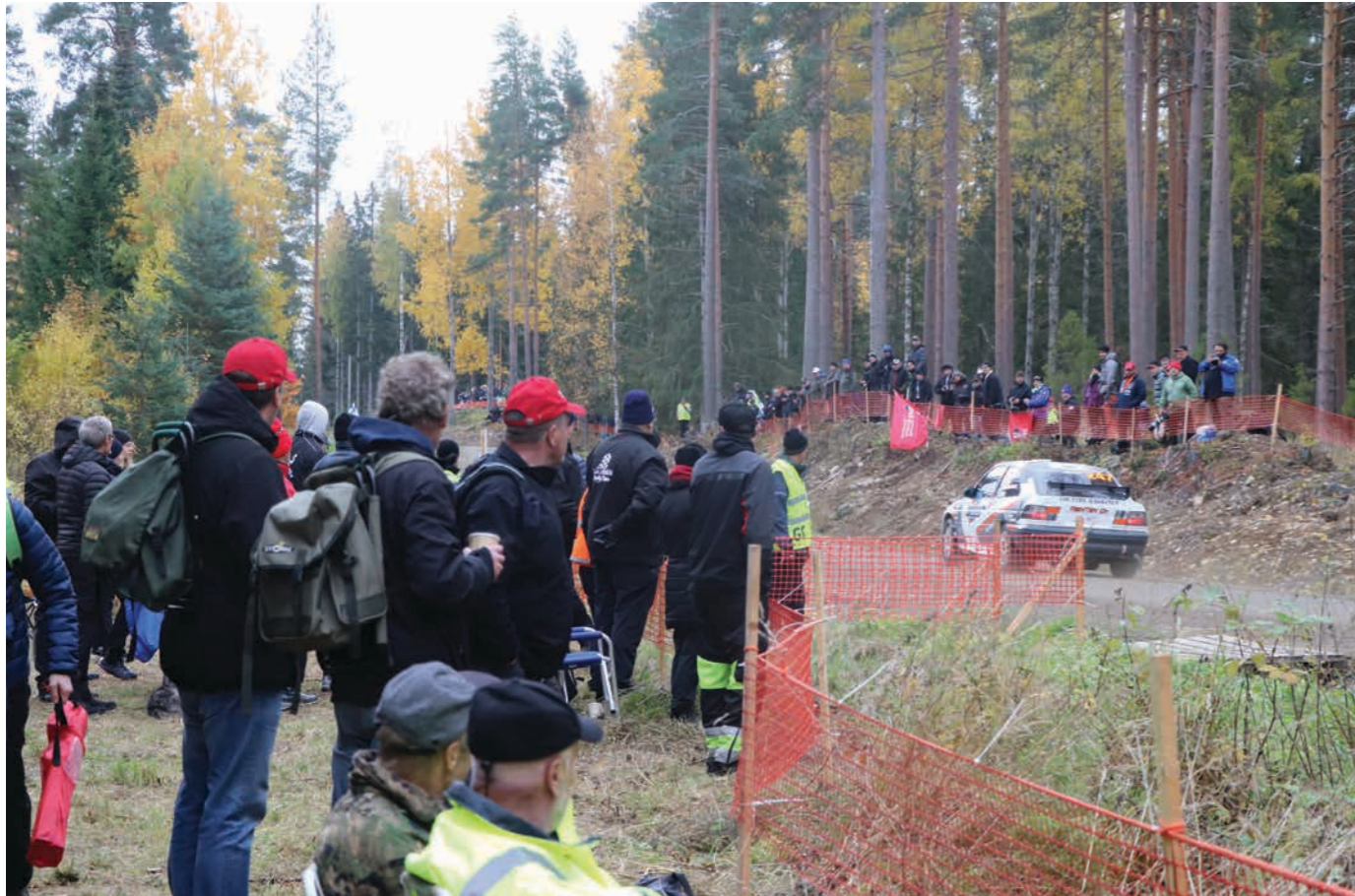
Ruskaralliksikin nimetyn rallipäivän lisäksi kylällä tehtiin yhteensä tuhansia talkootunteja sekä ennen että jälkeen rallin.