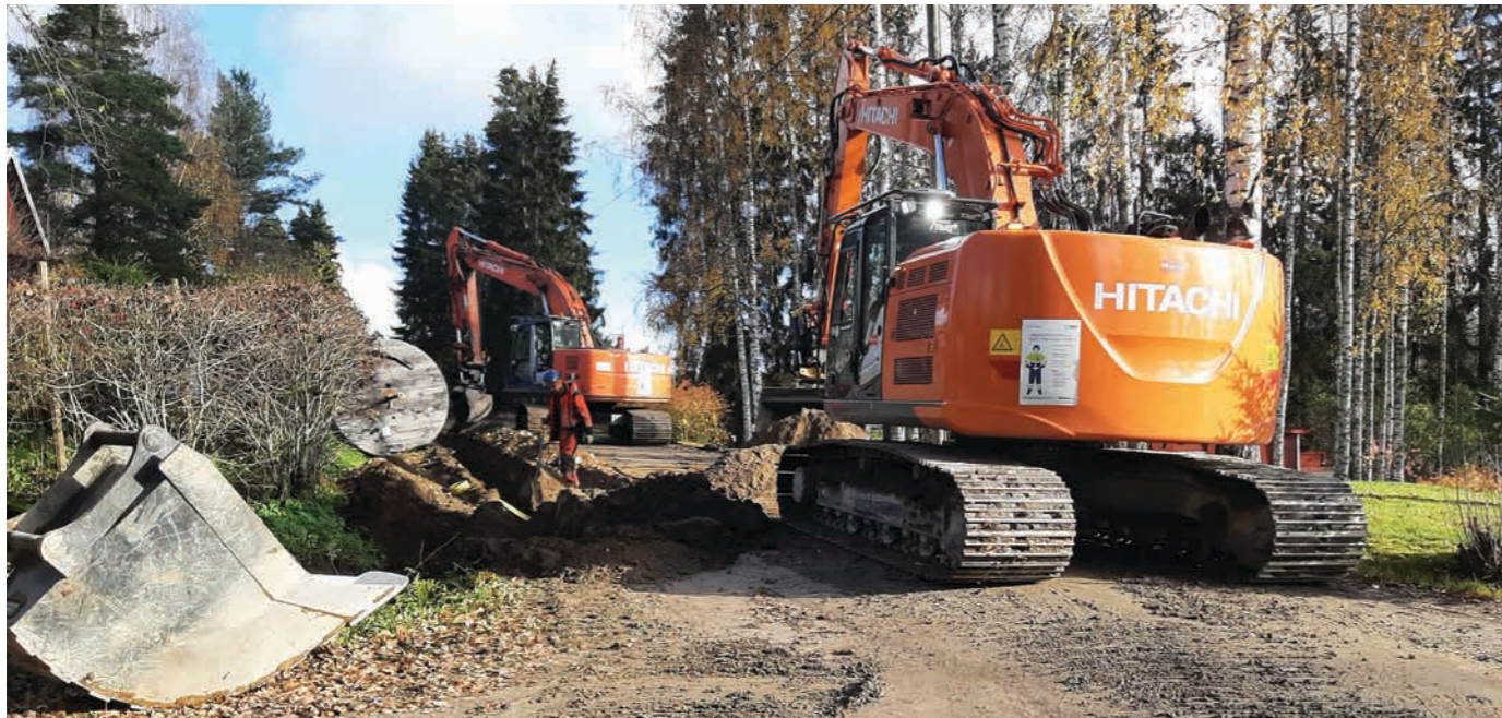
Hetki juuri ennen Pirtin risteysen rumpuputken kaivauksia.