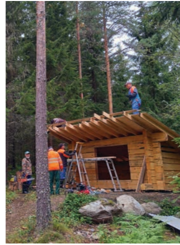
Elokuussa 2021 laavua ryhdytään kasaamaan luontopolun alkuun.