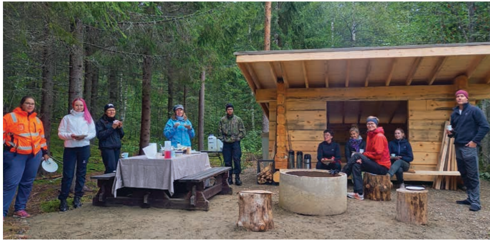
Ensimmäiset viralliset vieraat vasta valmistuneella laavulla: Pirkanmaan Ely-keskuksen luontoyksikön työntekijät viettivät kehittämispäivää Kuhmoisissa; he mm. meloivat pätjän Pitkänveden melontareittiä ja tulivat tutustumaan Sysipatterin luontopolkuun ja nauttivat välipalaa uudella laavulla.