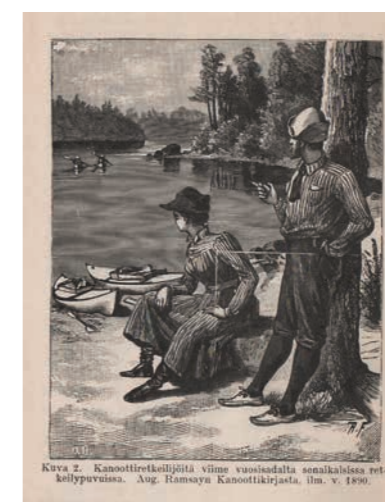
Kuva 2. Kanoottirehijöitä viime vuosisadalta senaikaisissa retkeilyvuosissa. Aug. Hanssonin Kanoottikirjasta, ilm. v. 1890.

Teksti: Ulla Lahtinen